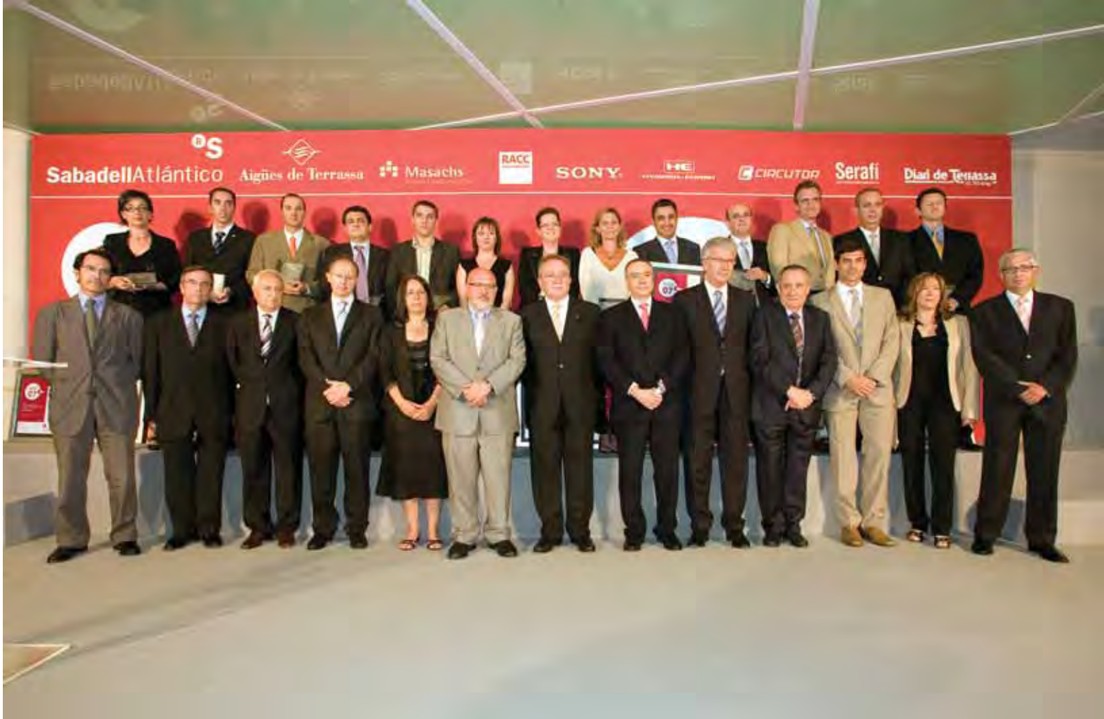
▲ Foto de família dels empresaris premiats amb les autoritats.