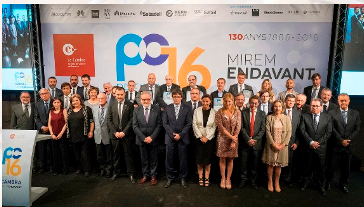
Fotografia de grup de l'acte de lliurament dels Premis Cambra 2016