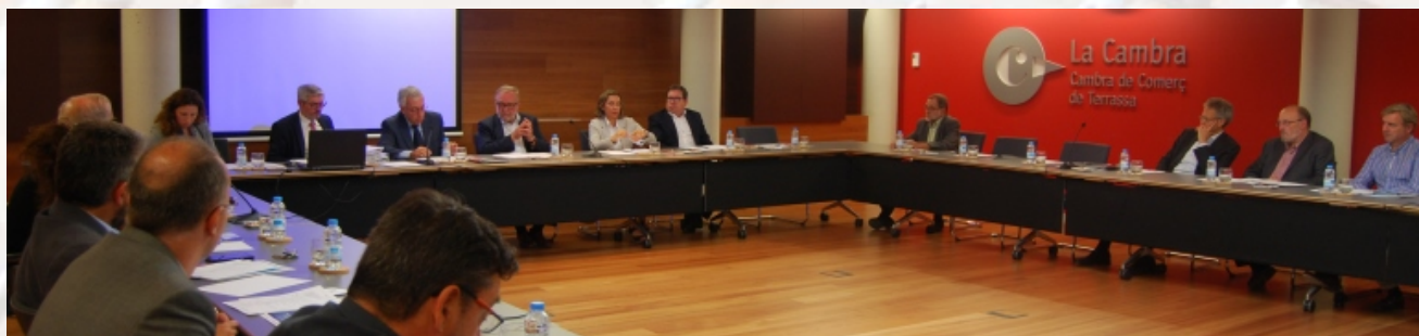
Fotografia d'una sessió del Ple de la Cambra

Format l'any 2016 per 39 persones, 35 de les quals representen els diferents sectors de l'activitat econòmica de la demarcació de Terrassa i 4 a les organitzacions empresarials, el Ple és l'òrgan suprem de govern i representació i com a tal adopta els acords principals per al desenvolupament de l'activitat de la Cambra.