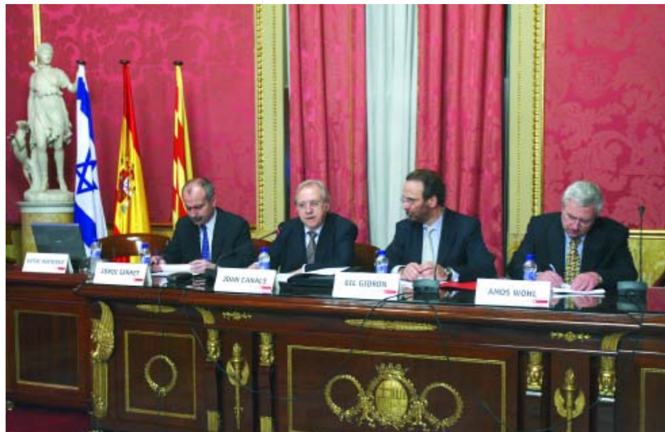
La constitución de esta nueva corporación ayudará a dinamizar las relaciones bilaterales

impulsar las relaciones comerciales con Israel, así como para dar a conocer las ventajas de operar en este país, organizada por la Cámara de Barcelona. La entidad empresarial pretende intensificar las relaciones entre las empresas de ambos países.