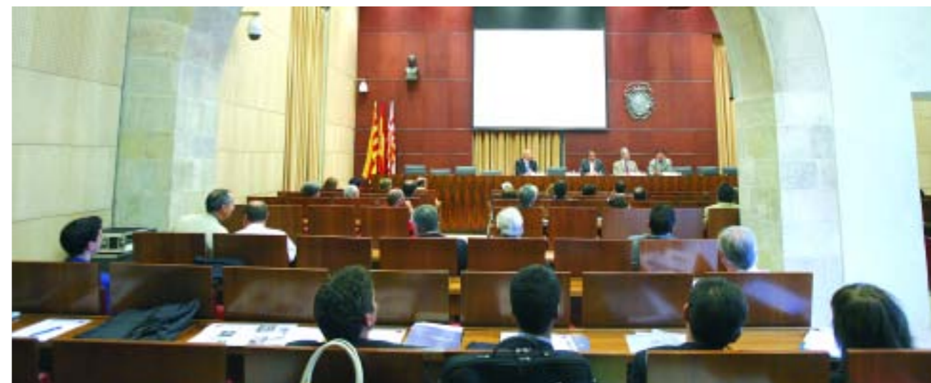
Si algo quedó claro en esta jornada es la creciente importancia de la logística en el comercio internacional